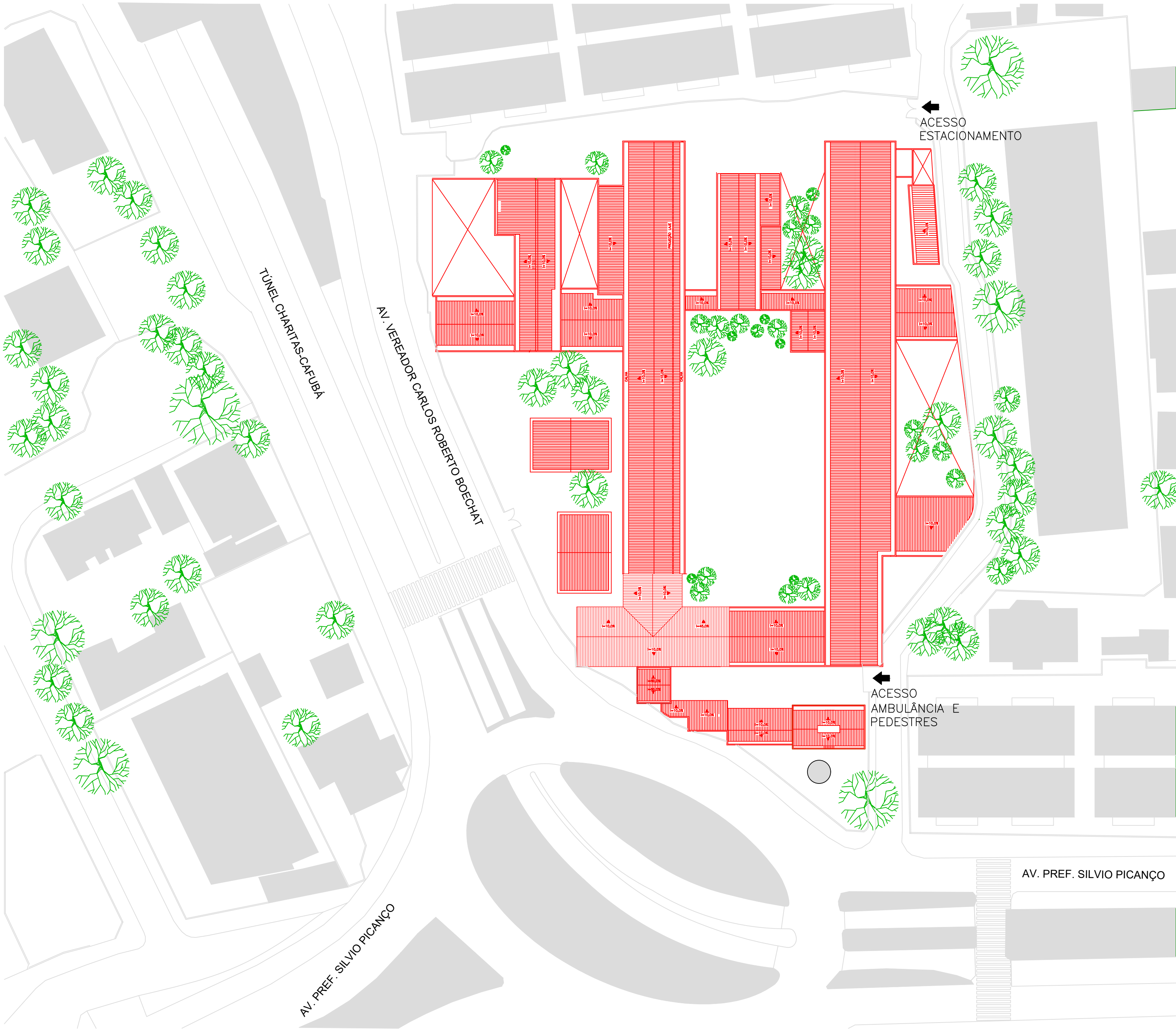
01 PLANTA DE SITUAÇÃO ESCALA: 1/500