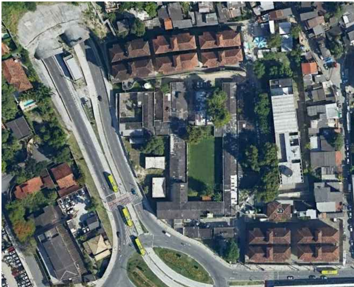
02 MAPA DE LOCALIZAÇÃO ESCALA: S/ESCALA